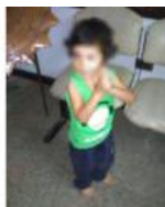
Río Cuarto: otra vez hallaron al niño de 3 años deambulando sólo en la madrugada