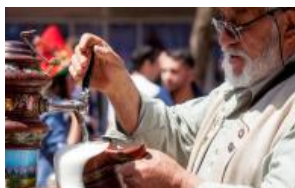
Programa de la Oktoberfest