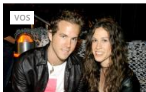
10 famosos que fueron pareja y probablemente no lo sabías