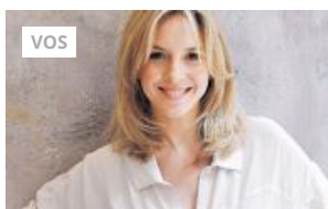
10 artistas que probablemente no sabías que eran cordobeses