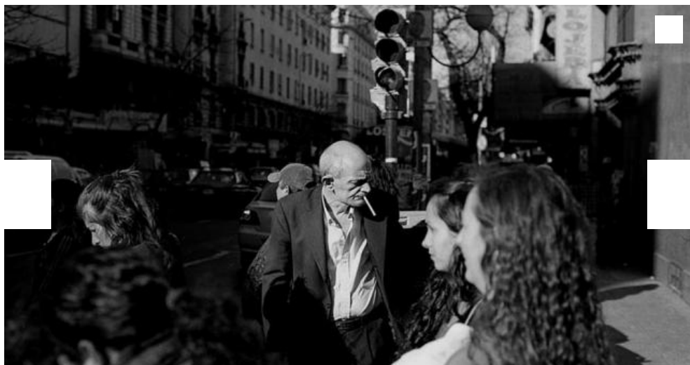
La intimidad se los sentimientos. Imagen de Laura Antonelli.