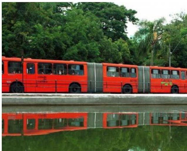
Curitiba, encuentro de culturas