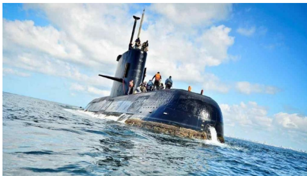
ARA San Juan, el submarino argentino que protagonizó una tragedia hace tres años.

A tres años de la tragedia, la Cámara Federal de Apelaciones de Comodoro Rivadavia se apresta a dictar una resolución en la causa que investiga el desastre y las probables responsabilidades políticas del gobierno nacional de entonces.