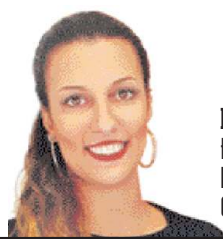
Irina Traktman Periodista - Locutora nacional. Coeditora