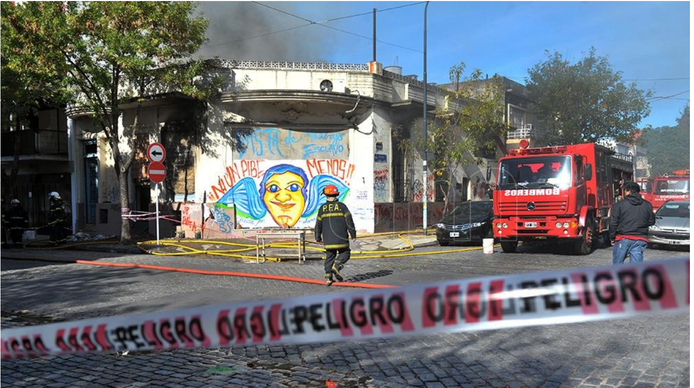
En el 2015, otro incendio, esta vez en el barrio de Flores, dejó dos niños muertos.

El lunes 27 de abril de 2015, un nuevo incendio en un taller textil en Páez 2796, en el barrio porteño de Flores, provocó a muerte de Rolando y Rodrigo, dos niños de 5 y 10 años y el tema volvió a estar en agenda mediática durante varios meses.