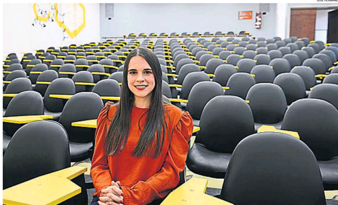
EGRESO VIRTUAL. Celeste cursó su último año y se recibió en la virtualidad. También tuvo colación a distancia. Lamenta la pérdida de contacto con profesores y compañeros.

La UNC estudia cómo será el nuevo modelo de cursado