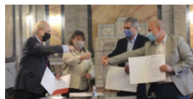
Alianza para la divulgación y enseñanza de las ciencias