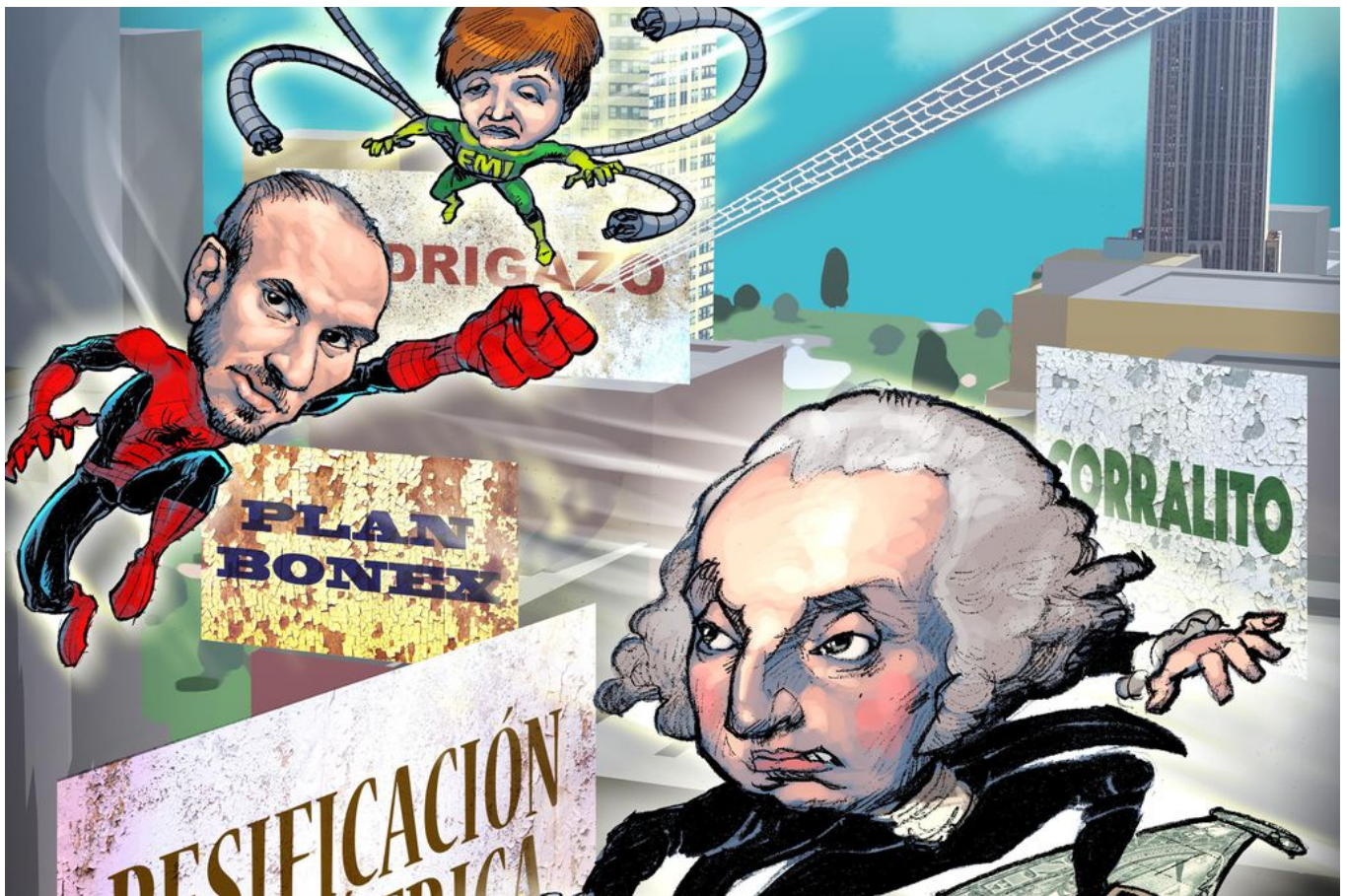
Ilustración Eric Zampieri