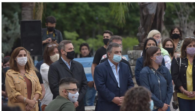
Ramón Mestre y Mario Negri el martes, frente al Carbó.

Horas después, fue la Junta Electoral la que rechazó esa "apelación" otorgada por la Mesa Ejecutiva "por carecer ese órgano de competencia".