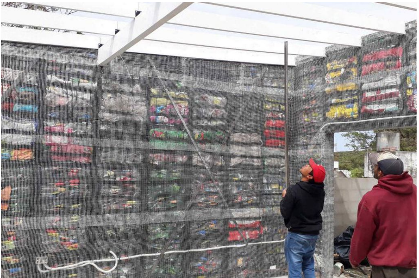
El modelo de 3C Construcciones, un ejemplo de los productos de la nueva economía.

Es organizado por la Secretaría de Extensión de la Facultad de Ciencias Económicas.