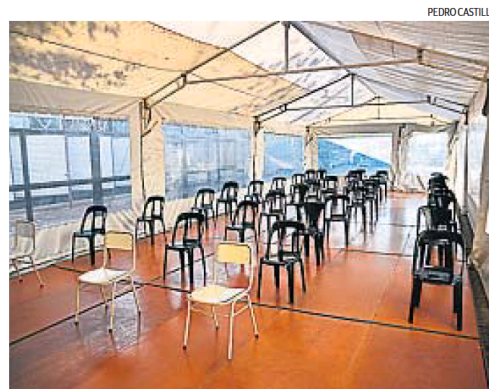
SIN VACUNAS. Los vacunatorios capitalinos casi no trabajaron esta semana.

La Unión de Educadores de la Provincia (UEPC) celebró la decisión, una de las medidas que venían reclamando para seguir sosteniendo la