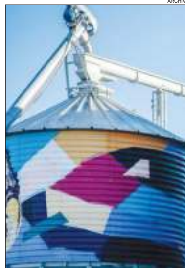
PEÑÓN DEL ÁGUILA. Un caso de crecimiento meteórico en el mercado nacional y, ahora, en el extranjero.

Por otra parte, al inicio de la cuarentena la firma aprovechó para sumar