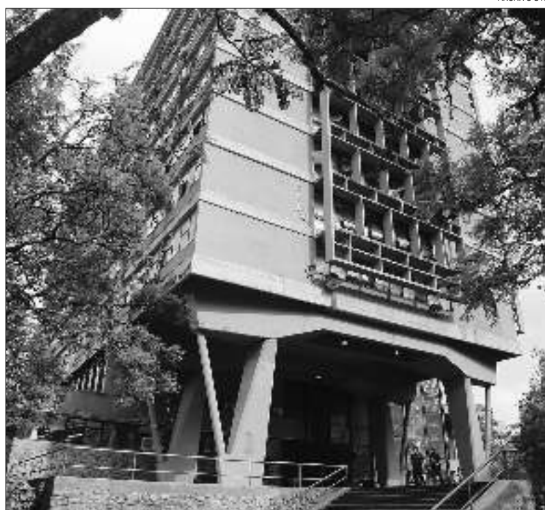
DESAFÍO. La comuna deberá consolidar una curva de vencimientos de mayor plazo.

Las demás condiciones son similares a las de emisiones anteriores, esto es plazos de pago, vencimientos, aviso de colocación y resultado y sistema de información a los mercados, entre otros. Al mismo tiempo, la norma estipula que "cada Serie se amortizará en la fecha de vencimiento, con arreglo a