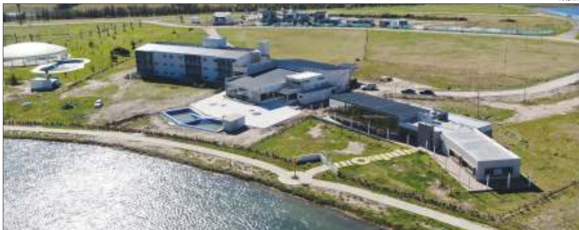
INAUGURACIONES. Howard Johnson abrirá este año en La Plata y Resistencia.

De este modo y si todo sigue según lo planeado, Days Inn comenzará a operar sus nuevos hoteles en el barrio porteño de Villa Devoto, los ubicados