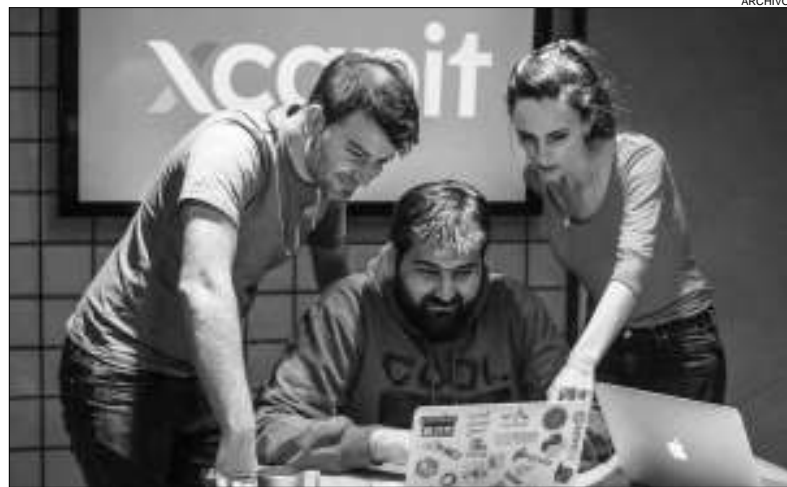
FUNCION. La empresa ofrece productos de inversión orientados al usuario final, que permiten que cualquier persona pueda invertir a través de criptos.