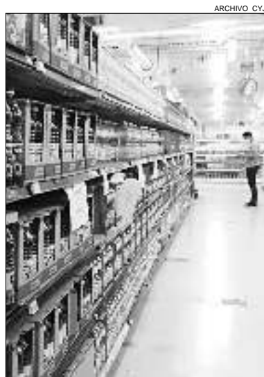
DESABASTECIMIENTO. El Gobierno nacional imputó ayer a 11 empresas de consumo masivo.

Se trata de Mastellone, Fargo, AGD, Danone, Molinos Cañuelas, Bunge, Molinos Río de la Plata, Unilever, P&G, Paladini y Potigian, que tendrán un plazo de cinco días hábiles para retomar la producción y comercialización en los niveles de capacidad máxima, so pena de enfrentar sanciones