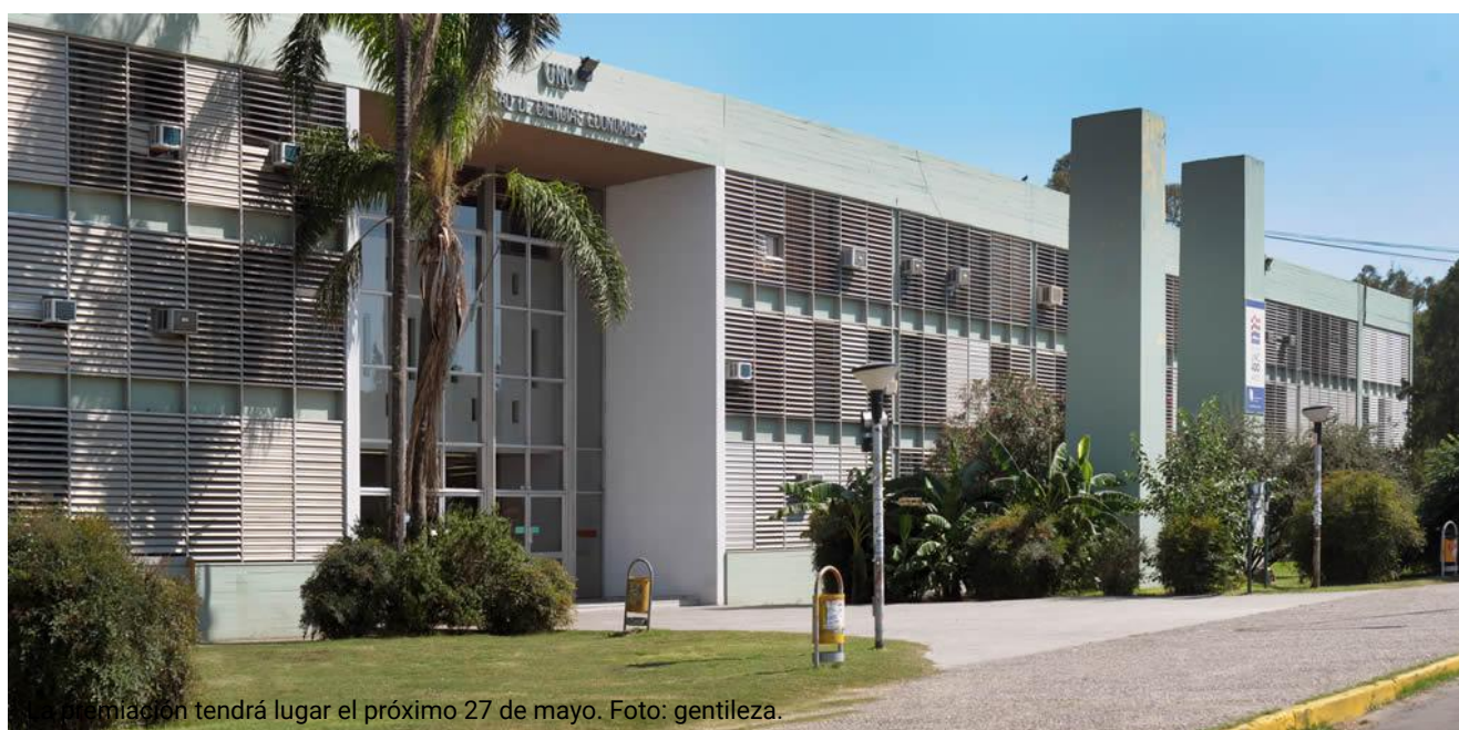
La premiación tendrá lugar el próximo 27 de mayo.

wa ( https://api.whatsapp.com/send?text=UNC: Ciencias Económicas distinguirá a sus graduados y graduadas ) https://lmdiaro.com.ar/contenido/284315/unc-ciencias-economicas-distinguir-a-sus-graduados-y-graduadas )