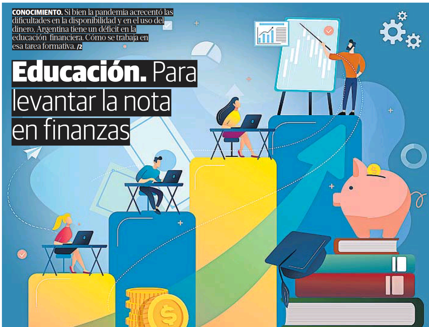
ILUSTRACIÓN DE OSCAR ROLDAN