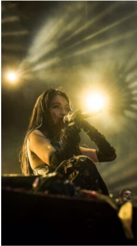
Cosquín Rock 2022.