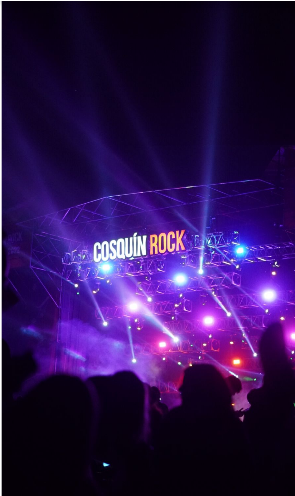
Cosquín Rock 2022.