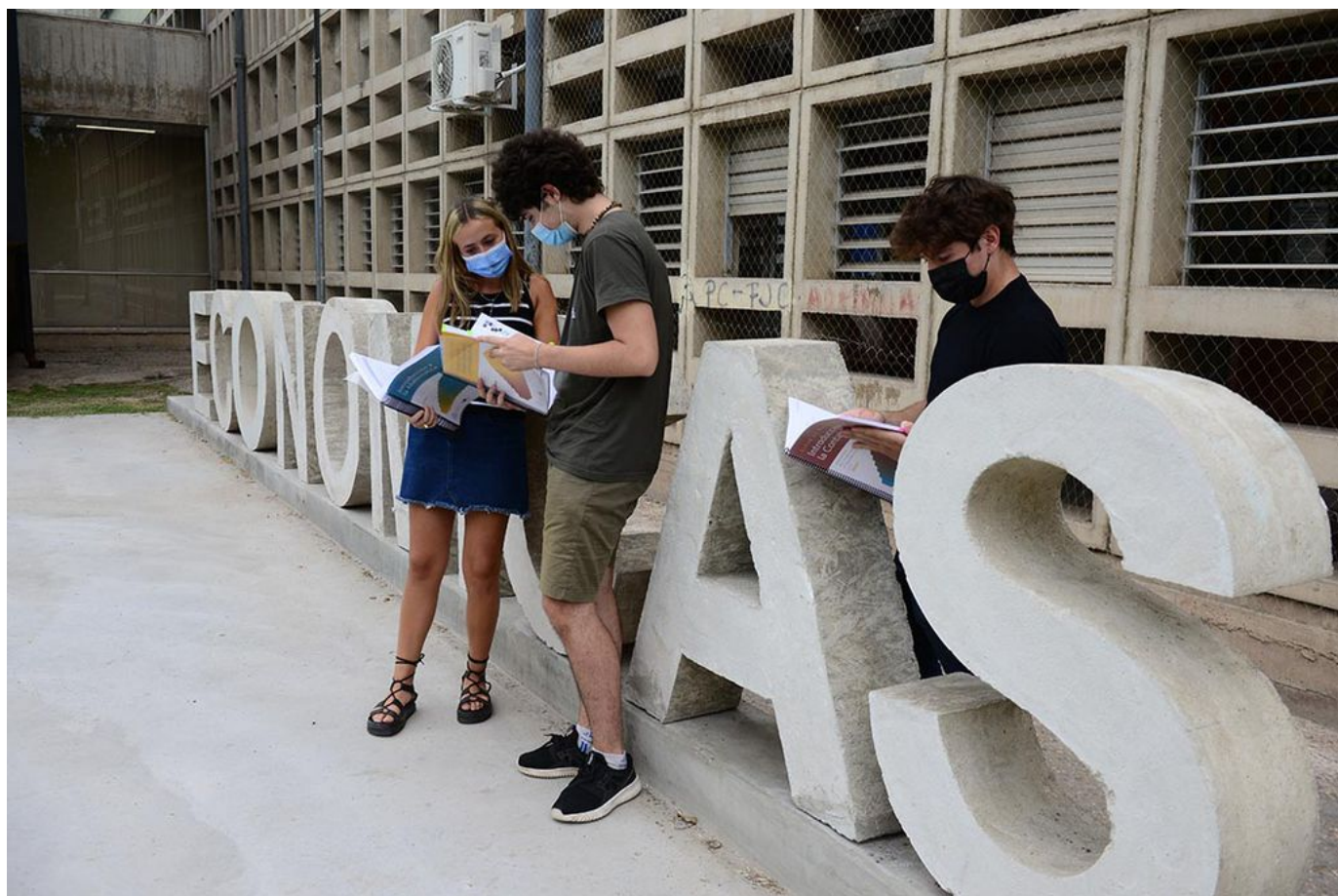
Las personas con título universitario ganan por lo general más que aquellas que sólo terminaron la escuela secundaria. (José Gabriel Hernández)

Eso revela un informe de la ONG Argentinos por la Educación, tomando como base la formación de nivel medio y universitaria.