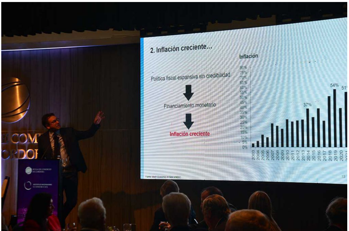
La Bolsa anunció una nueva incorporación a su equipo de economistas.

Las primeras señales de Batakis ratifican “restricciones” que desalientan a los agentes económicos y no generan certidumbre.