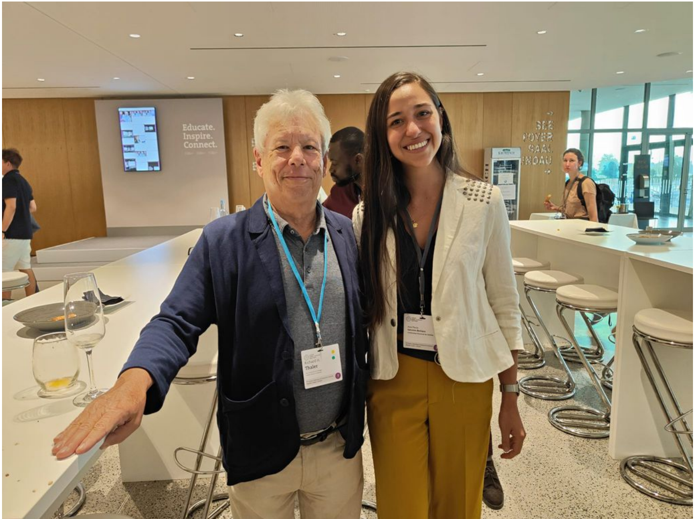
La cordobesa de Deán Funes con el premio Nobel de Economía 2017, Richard Thaler.

Destaca, a su vez, que “todas las interacciones con los distintos premiados fueron muy interesantes, son muy abiertos y generosos para compartir conocimientos y anécdotas”.