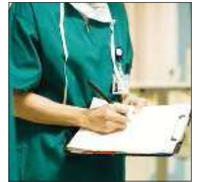
REPERCUSIONES. Fesprosa quiere la ampliación hacia el salario.

Incide sobre médicos, auxiliares y técnicos de la salud, de todos los nosocomios públicos o privados del país, independientemente de la cantidad de horas. Deberá verse reflejada en el recibo de sueldo del sujeto que tenga su cargo la liquidación de su haber