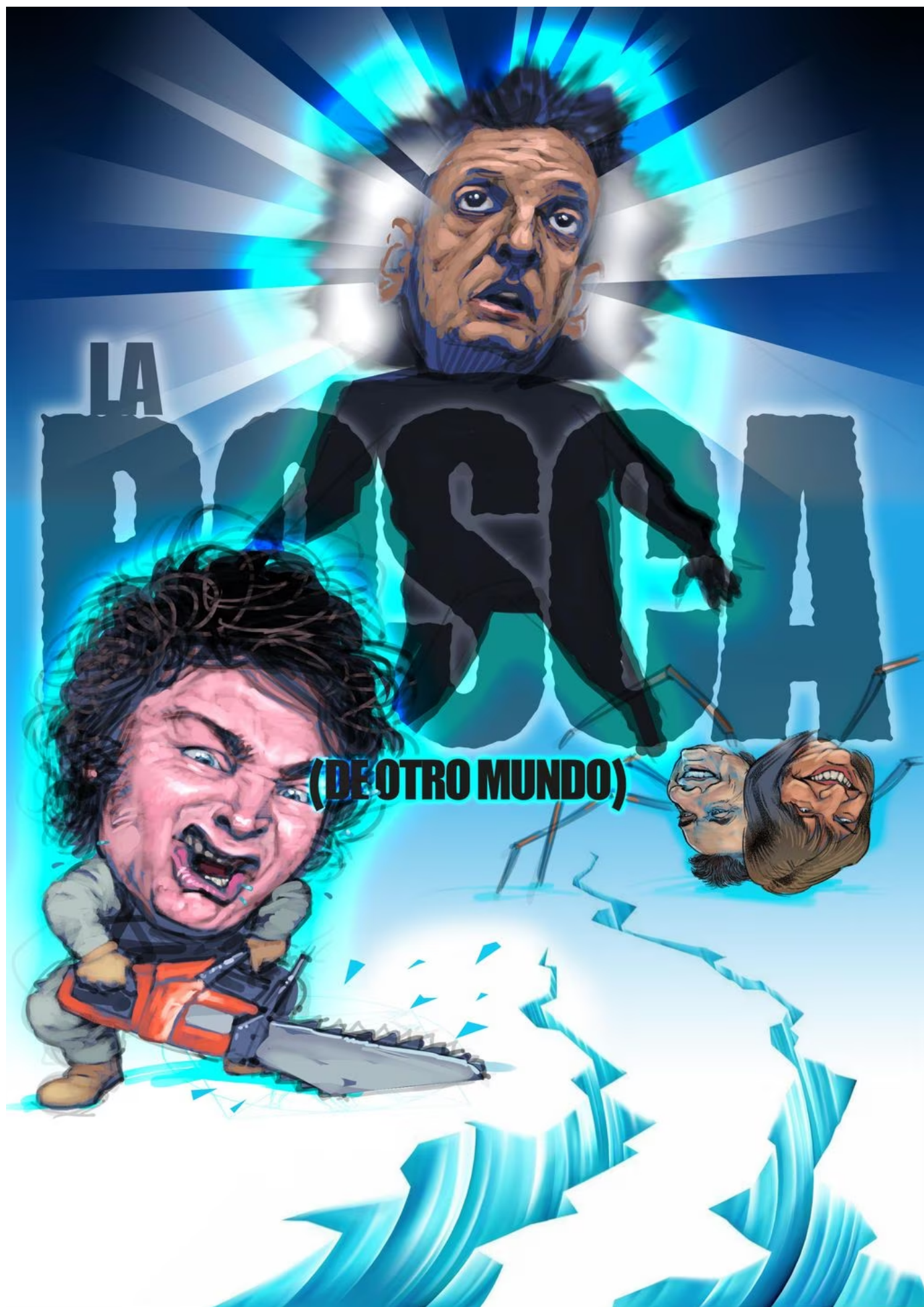
Ilustración Eric Zampieri.