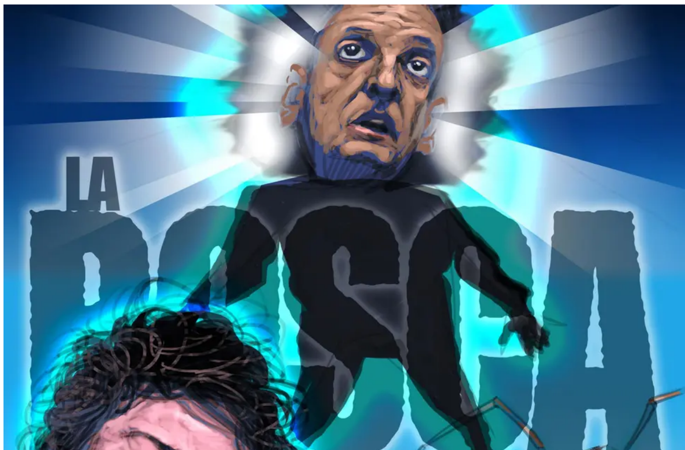
Ilustración Eric Zampieri.