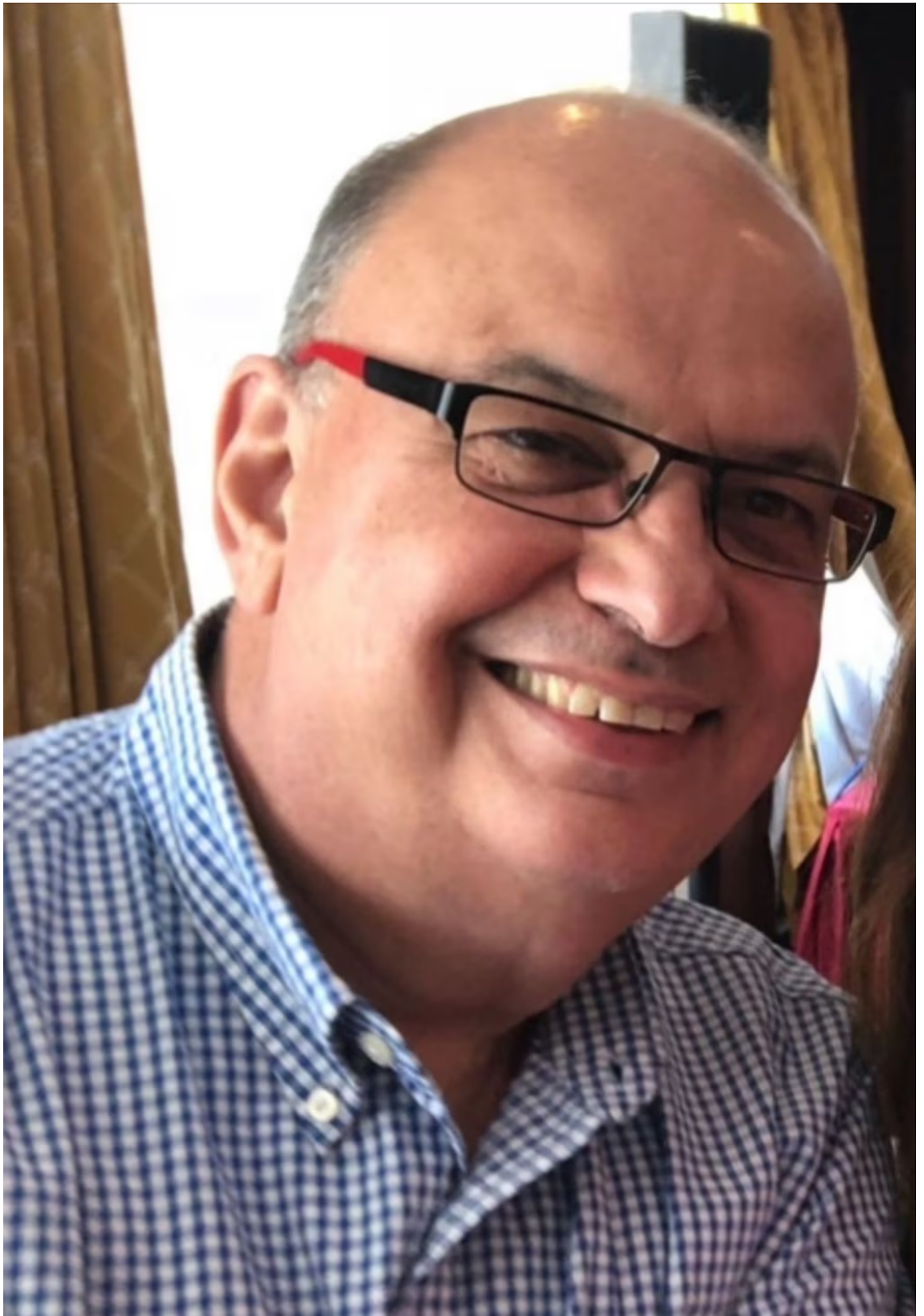
Gustavo Demarco, economista cordobés y especialista en sistemas previsionales del Banco Mundial.