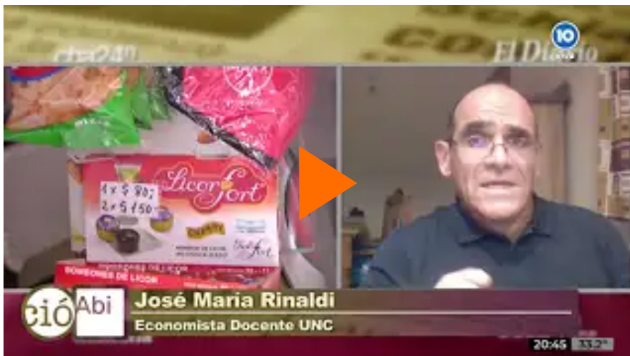
Medidas económicas: ajuste y devaluación en Redacción Abierta, en Redacción Abierta