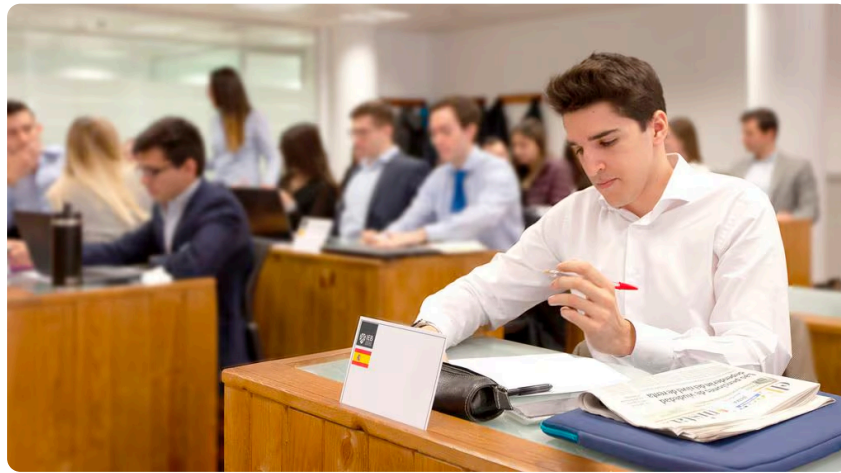
Los jóvenes buscan fortalecer su perfil laboral a poco de egresar de su carrera de grado. (IEB)