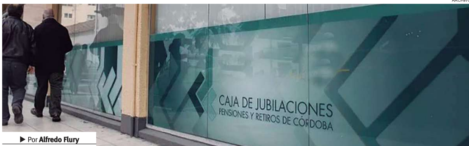
Por Alfredo Flury