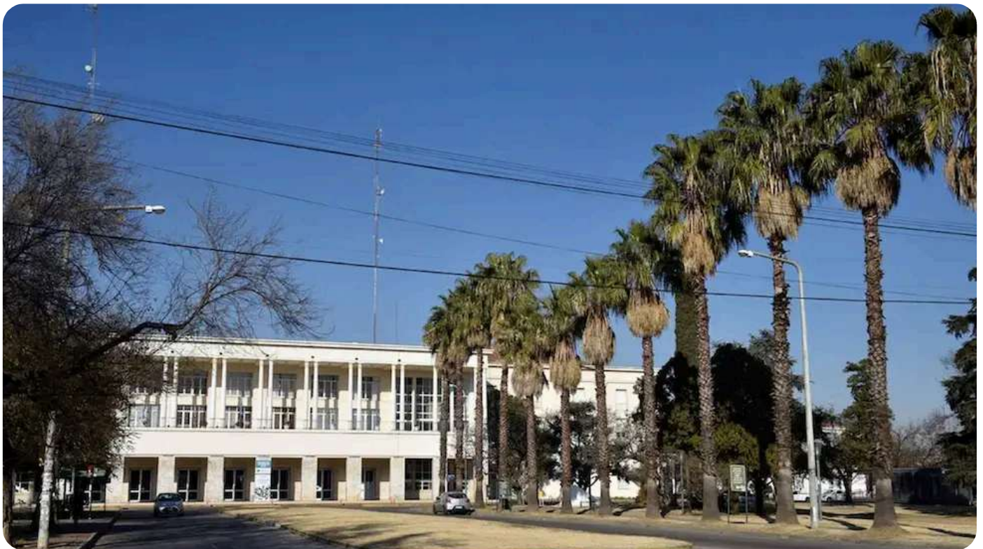
El Pabellón Argentina de la UNC.