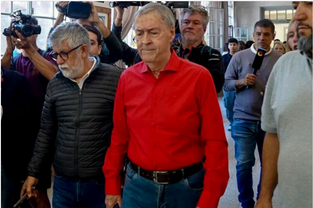
El diputado y exgobernador Juan Schiaretti