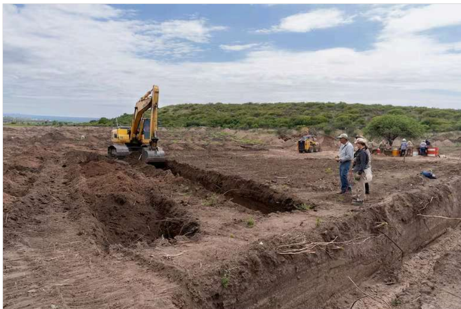
Las excavaciones en el centro clandestino de detención La Perla, en Córdoba