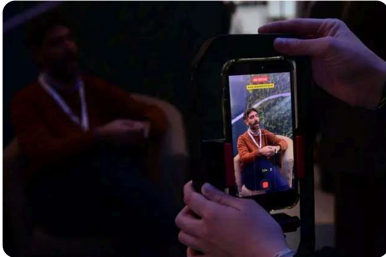
Proyectar Córdoba 2026, el evento del desarrollismo y el sector inmobiliario más importante del interior del país. (Ramiro Pereyra)

Los paneles permitieron conocer experiencias concretas, casos de aplicación y perspectivas sobre el futuro de una industria que atraviesa una profunda evolución tecnológica.