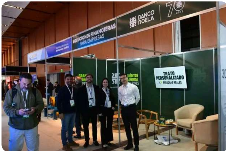
Proyectar Córdoba 2026, el evento del desarrollismo y el sector inmobiliario más importante del interior del país. (Ramiro Pereyra)

La propuesta analizó cómo la integración de información en entornos colaborativos permite optimizar la planificación, mejorar la coordinación entre equipos, reducir costos, minimizar imprevistos y elevar la calidad de las obras.