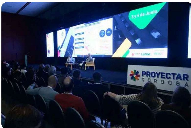
Proyectar Córdoba 2026, el evento del desarrollismo y el sector inmobiliario más importante del interior del país.

La conversación abordó tendencias vinculadas con la digitalización de operaciones, la aplicación de inteligencia artificial en el negocio inmobiliario y la construcción, el desarrollo de ciudades inteligentes, la metodología BIM, la gestión de datos y el rol de la innovación como factor estratégico para impulsar el crecimiento empresarial.