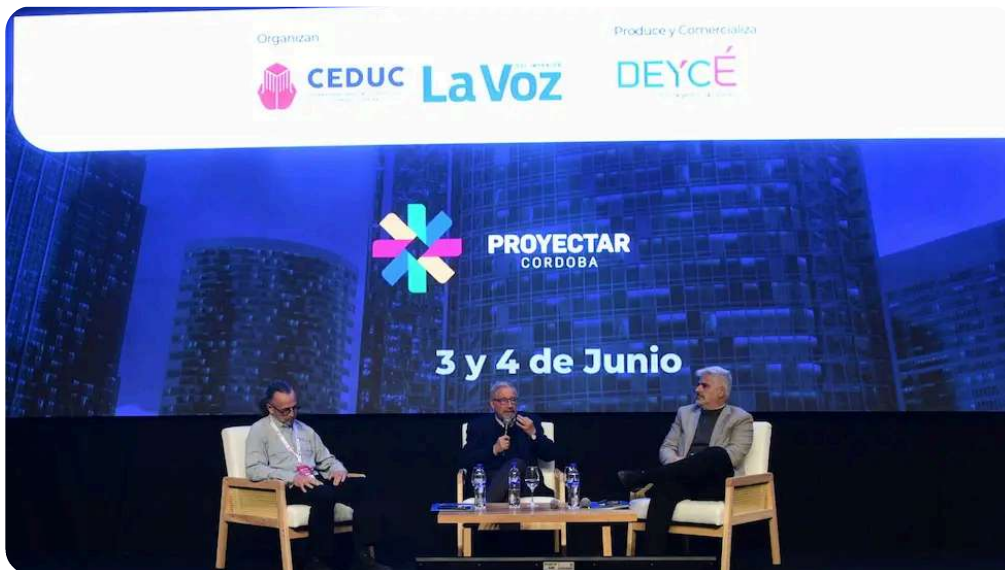
Proyectar Córdoba 2026, el evento del desarrollismo y el sector inmobiliario más importante del interior del país.

Córdoba recibe una nueva edición de Proyectar Córdoba , el principal encuentro de desarrollismo, construcción e innovación del país, que reúne a empresarios, profesionales, desarrolladores, arquitectos,